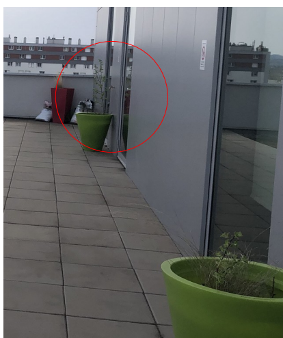
5 ème étage

Le modèle du té en laiton est laissé au choix de l'entreprise. Il devra être validé par la MOE.